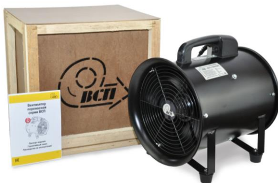
Рис. 3.1 Общий вид

Дополнительно вентиляторы могут быть укомплектованы: