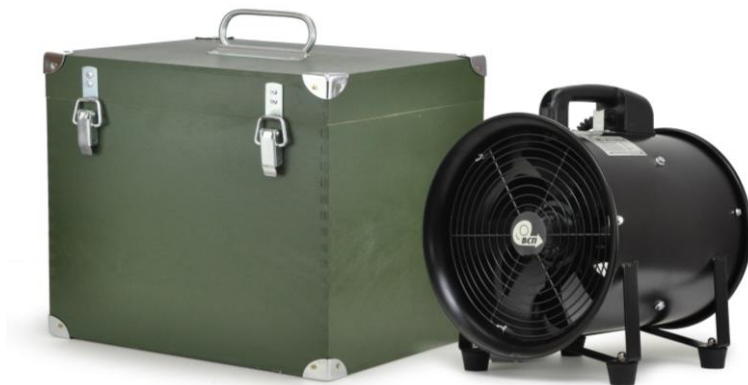
Рис. 12.7 Защитный кейс вентилятора

Защитный кейс, имеющий надёжную вандалостойкую конструкцию по армейскому образцу, предназначен для хранения и транспортировки изделия, что продлевает срок эксплуатации вентилятора. Кейс можно также использовать в качестве подставки для вентилятора. Для удобства транспортировки кейс снабжён складной ручкой.