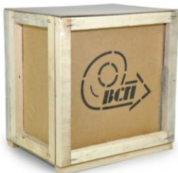
Рис. 11.1. Общий вид упаковки