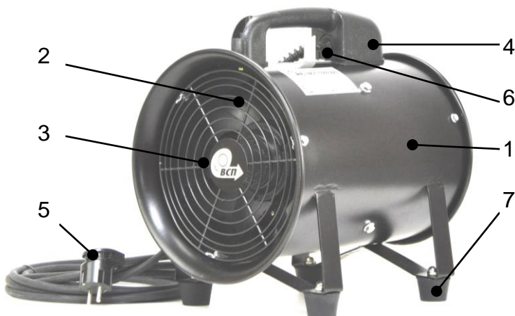
Рис. 4.1. Общий вид вентилятора (на примере ВСП-1000/220)