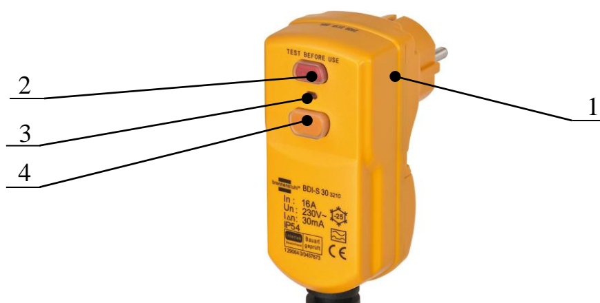
Рис. 4.2. Общий вид штепсельного разъёма, совмещённого с УЗО