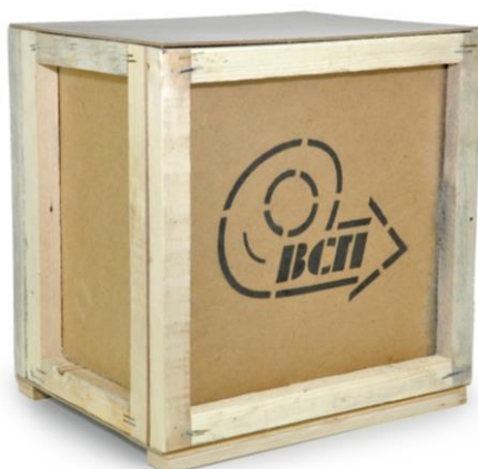
Рис. 11.1. Общий вид упаковки

* - фактическая масса брутто может отличаться от указанной в пределах 0,5 кг.